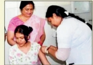
छात्रा को वैक्सीन लगाती डॉक्टर।