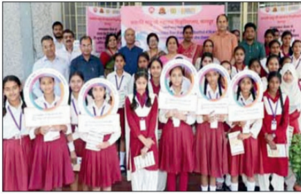
टीकाकरण करने वाली छात्राएं।