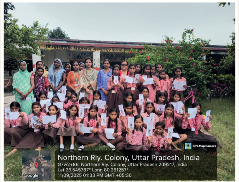
Northern Rly. Colony, Uttar Pradesh, India G7w2+86, Northern Rly. Colony, Uttar Pradesh 209217, India Lat 26.545787° Long 80.251257° 11/09/2025 01:33 PM GMT +05:30