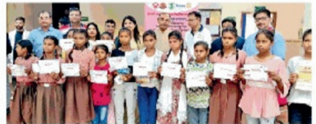
सीएसजेएमयू में आयोजित शिबिर में प्रमाण पत्र के साथ बालिकाएं