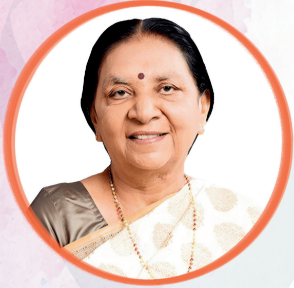
प्रेरणा स्रोत श्रीमती आनंदीबेन पटेल मा. कुलाधिपति एवं राज्यपाल, उत्तर प्रदेश

सर्वाङ्कल कैंसर से बचाव हेतु टीकाकरण के सम्बन्ध में जागरूकता