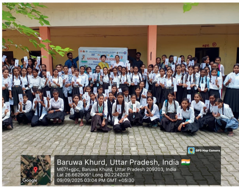
Baruwa Khurd, Uttar Pradesh, India M67f+gpc, Baruwa Khurd, Uttar Pradesh 209203, India Lat 26.662906° Long 80.224203° 09/09/2025 03:04 PM GMT +05:30