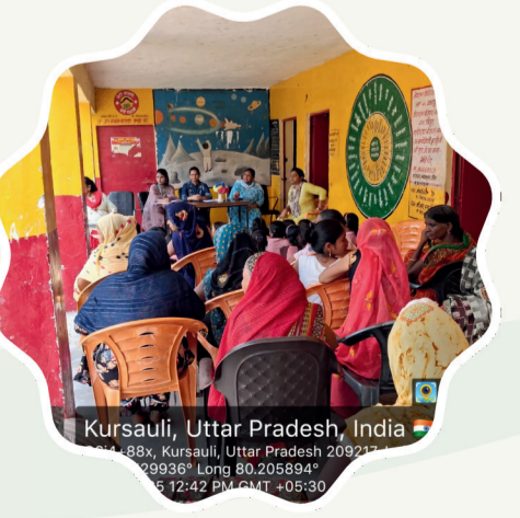
Katri Shankar Pur Sarai, Uttar Pradesh