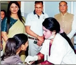
छात्रा को वैक्सीन लगाती डॉक्टर।