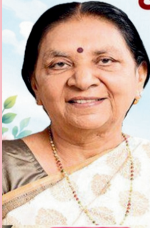
प्रेरणा स्रोत श्रीमती आनंदीबेन पटेल मा. कुलाधिपति एवं राज्यपाल उत्तर प्रदेश