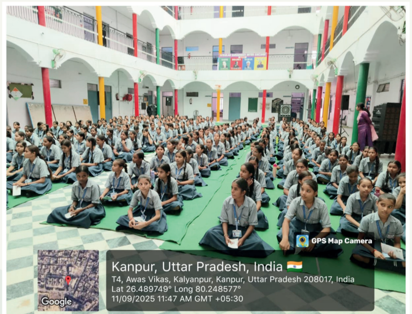
Kanpur, Uttar Pradesh, India T4, Awas Vikas, Kalyanpur, Kanpur, Uttar Pradesh 208017, India Lat 26.489749° Long 80.248577° 11/09/2025 11:47 AM GMT +05:30