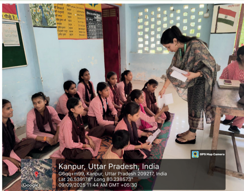
Kanpur, Uttar Pradesh, India G6qq+m99, Kanpur, Uttar Pradesh 209217, India Lat 26.539178° Long 80.238573° 09/09/2025 11:44 AM GMT +05:30